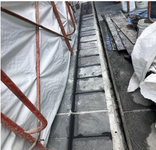
ยาแนวฟุตบาท